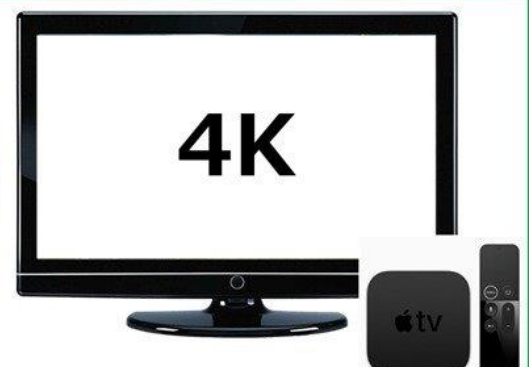
4Kテレビ + 「Apple TV 4K」