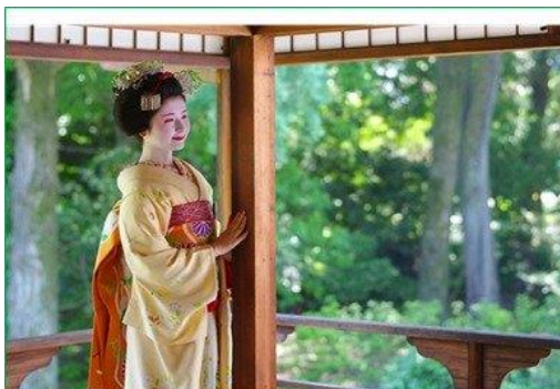
撮影会で撮影された写真